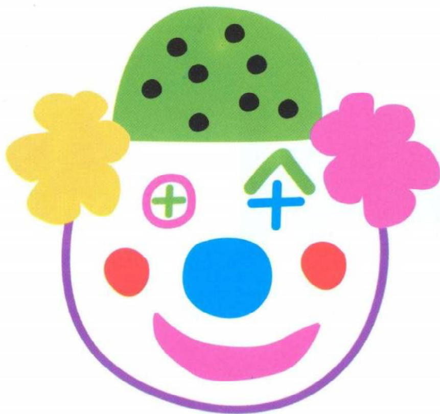
Lulu, le fils