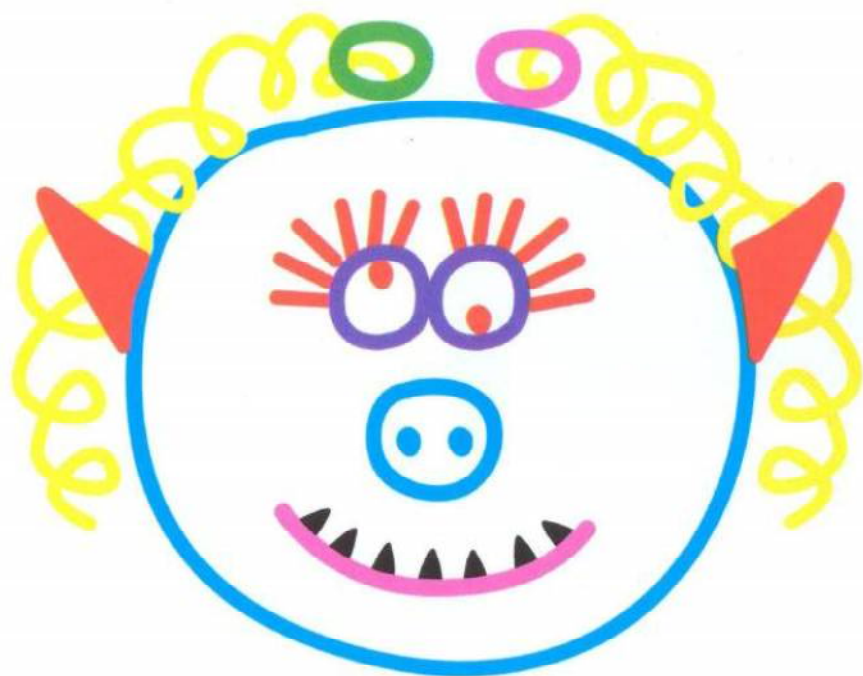
Babou, la fille