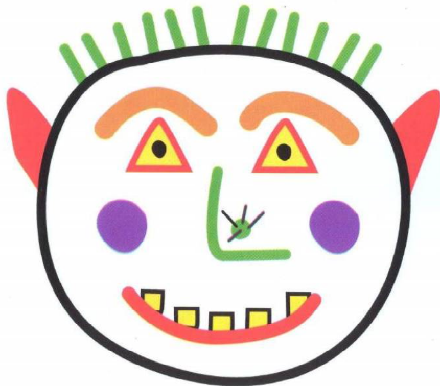
Zozo, le fils