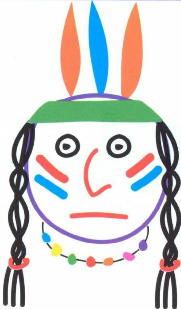
Plume de feu