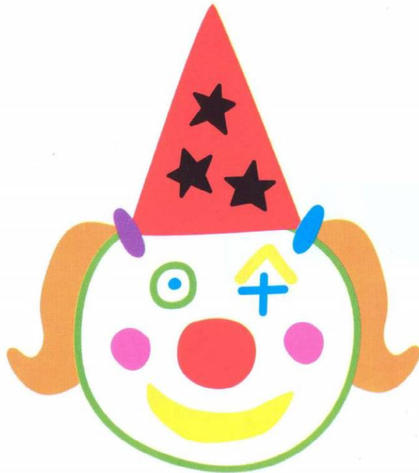
Lila, la fille